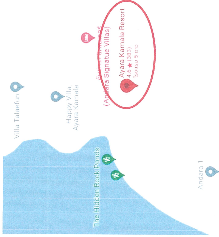
รูปภาพที่ 1.2 แผนที่ตั้งของโครงการ โรงแรม ไอยรา กลมา รีสอร์ท แอนด์ สปา (เปลี่ยนการใช้อาคาร)

รายงานผลการปฏิบัติตามมาตรการป้องกันและแก้ไขผลกระทบสิ่งแวดล้อมและมาตรการติดตามตรวจสอบคุณภาพสิ่งแวดล้อม โครงการ โรงแรม ไอยรา กลมา รีสอร์ท แอนด์ สปา (เปลี่ยนการใช้อาคาร) ระยะดำเนินการ ระหว่างเดือนกรกฎาคม - ธันวาคม 2567