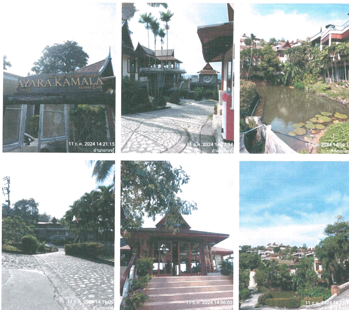
รูปภาพที่ 1.4 การใช้พื้นที่ของโครงการ