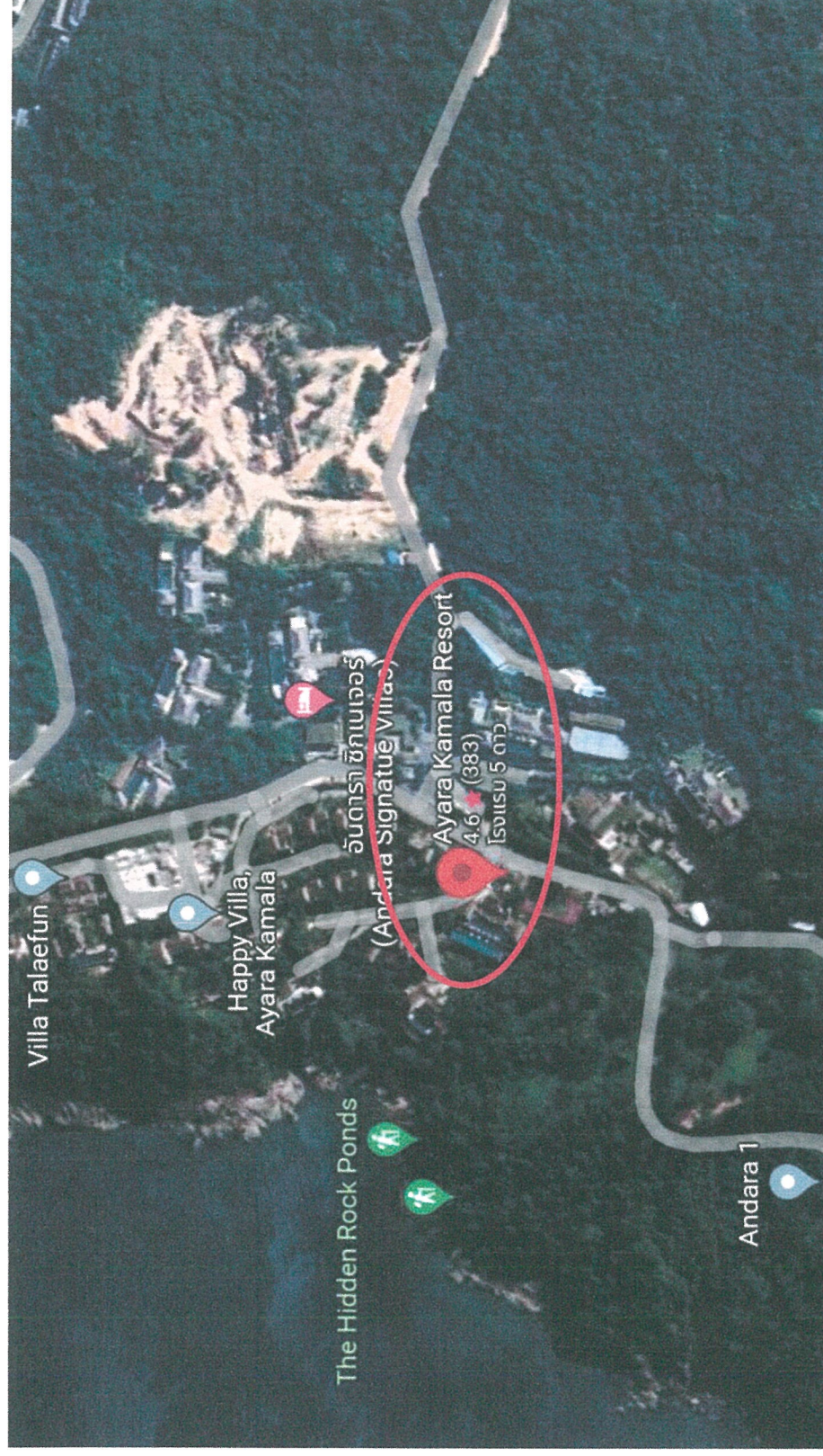
รูปภาพที่ 1.1 แผนที่ตั้งโครงการ โรงแรม โอเอรา รีสอร์ท แอนด์ สปา (เปลี่ยนการใช้อาคาร) (Top view)

รายงานผลการปฏิบัติงานร่วมกันและแก้ไขผลกระทบสิ่งแวดล้อมและมาตรการติดตามตรวจสอบคุณภาพสิ่งแวดล้อม โครงการ โรงแรม โอเอรา รีสอร์ท แอนด์ สปา (เปลี่ยนการใช้อาคาร) ระยะดำเนินการ ระหว่างเดือนกรกฎาคม - ธันวาคม 2567